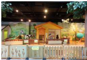
자연놀이터 ※ 48개월 미만까지 입장 가능합니다.