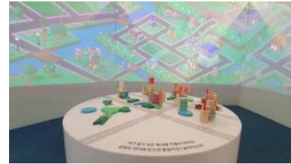
도전! 어린이 건축가