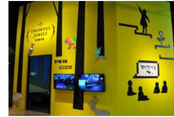
별난전시실 컬러풀 정글