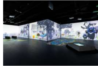
두 개의 DMZ