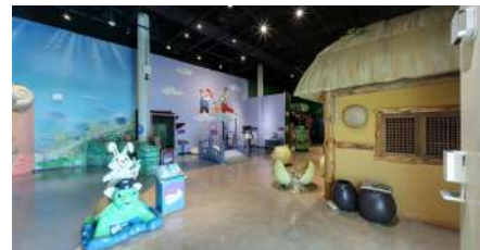
동화 속 보물찾기