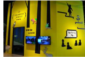
별난전시실 컬러풀 정글