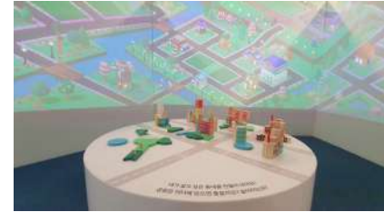
도전! 어린이 건축가