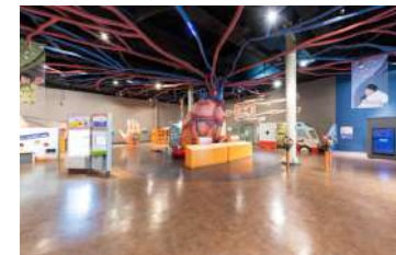
우리 몸은 어떻게?